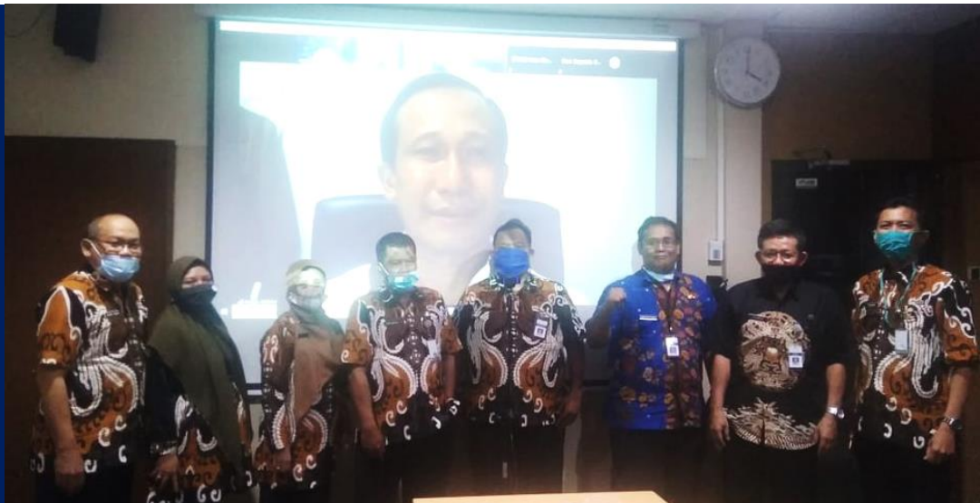
Gambar 4. Kegiatan Verifikasi Website Badan Publik

Nilai Verifikasi : (90 + 40 + 97,3 + 100) / 4 = 81,825