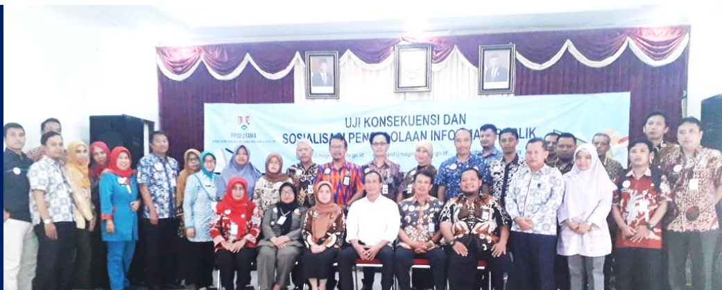
Gambar 3. Kegiatan Uji Konsekuensi dan Sosialisasi Pengelolaan Informasi Publik