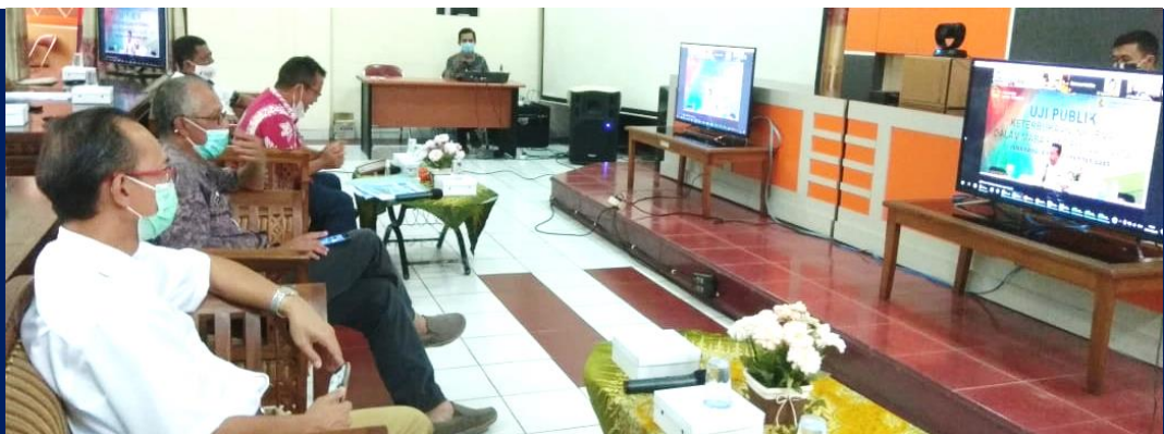
Gambar 5. Kegiatan Uji Publik

Dilaksanakan pada Kamis, 26 November 2020 Jam 13.00 – 15.00 bertempat di Aula Bappeda Kota Magelang, dengan paparan dilaksanakan oleh Sekretaris Daerah Kota Magelang, dengan nilai 92,8.